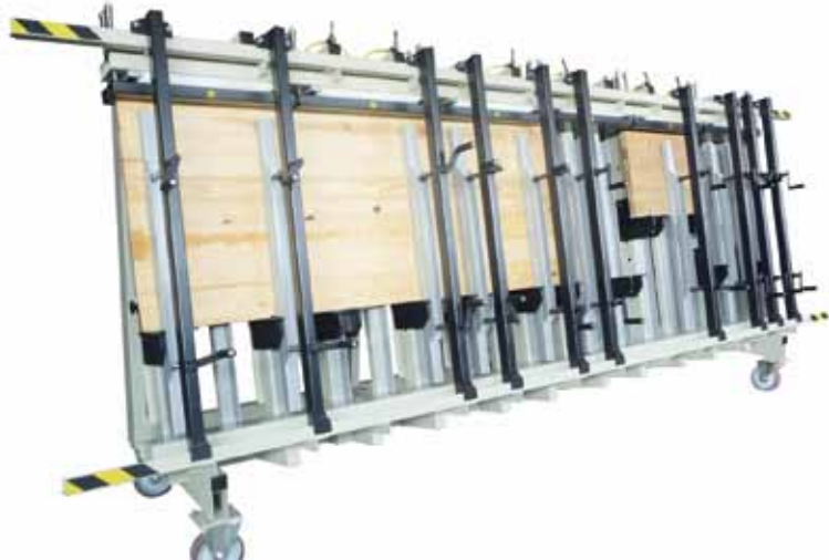
Prasa trapezowa jednostronna.