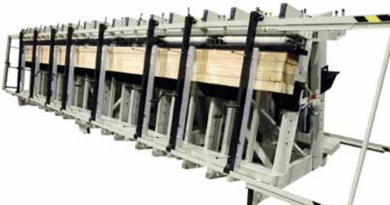
Prasa trapezowa dwustronna.