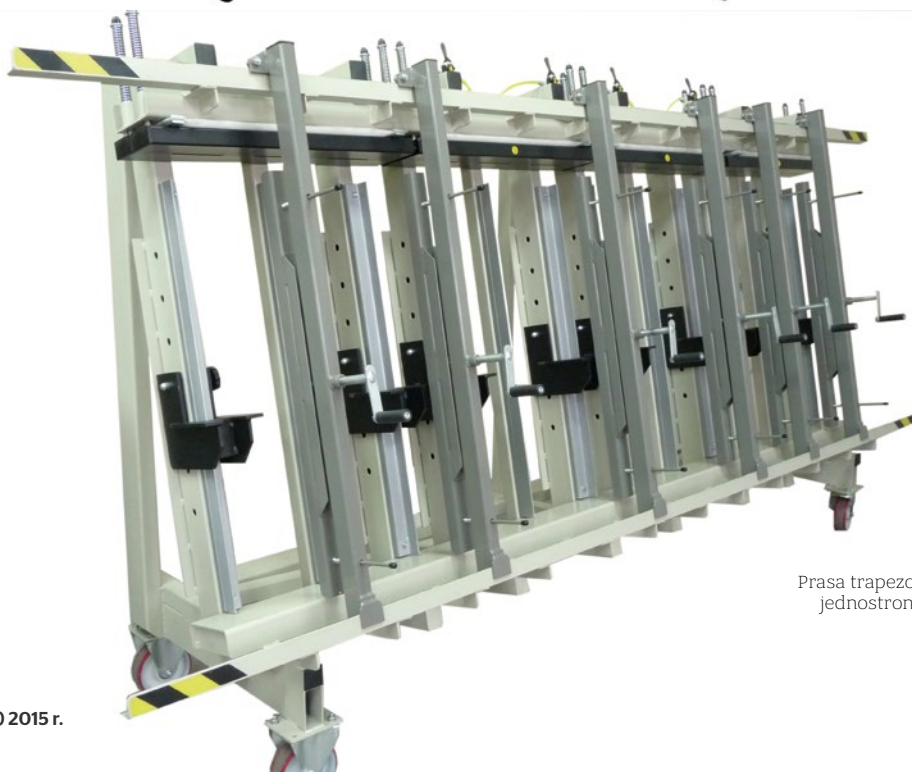
Prasa trapezowa jednostronna.