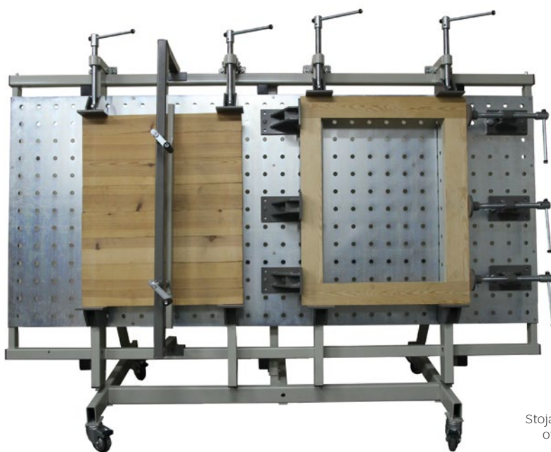
Stojak z płytą otworową.

W salonie firmowym STEBLO w Nowym Tomyślu, na ul. Leśnej 11 istnieje możliwość obejrzenia oferowanych przez firmę urządzeń, a także uzyskania wyczerpujących informacji technicznych oraz zapoznania się z pełną dokumentacją techniczno-ruchową maszyn. Firma zapewnia również fachowe doradztwo przy wyborze optymalnego urządzenia, najlepiej dostosowanego do indywidualnych potrzeb kupujących.