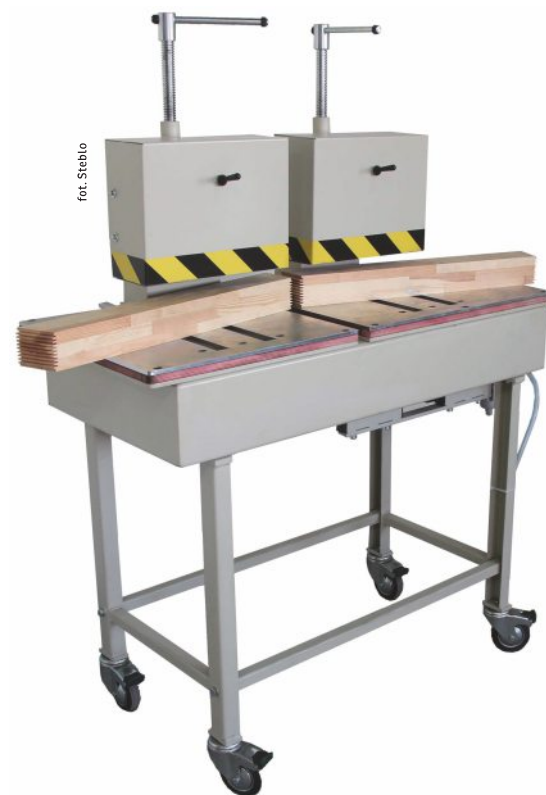
Przy zastosowaniu prasy do klejenia na mikrowczepy można kleić np. kantówkę pod różnym kątem.

Na prasie montażowej wyposażonej w płytę otworową oraz belki wyrównujące można wykonywać wiele operacji – kleić okna, fronty meblowe czy elementy łukowe.